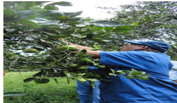
Figura 5. Toma de muestras de psílidos en huertas comerciales