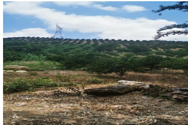
Figura 7. Control biológico del PAC en huertos de traspatio y huertos comerciales

f) Entrenamiento: Con el propósito de difundir la estrategia operativa de la Campaña, así como la sensibilización hacia los productores sobre la importancia de las enfermedades y adopción de las acciones mediante el establecimiento de AMEFIs, se realizaron 4 Talleres Participativos en los Municipios de Fco. Z, Mena, correspondiente a la Región Sierra Norte; Acateno y Ayotoxco de Guerrero, correspondientes a la Región Sierra Nororiental. Con esta acción se benefició un total de 96 productores.