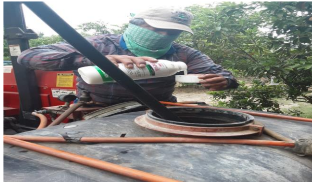
Figura 7. Control químico del PAC en huertos comerciales

e) Control biológico. Se llevó a cabo la liberación de 245,500 insectos de Tamarixia radiata en 79 huertos comerciales de las Comunidades de La Esperanza y Palma Real, correspondientes al Mpio. de Fco. Z. Mena, cubriendo un total de 614.00 hectáreas. Los insectos benéficos liberados, corresponden a adquisición realizada con recursos del ejercicio 2020.