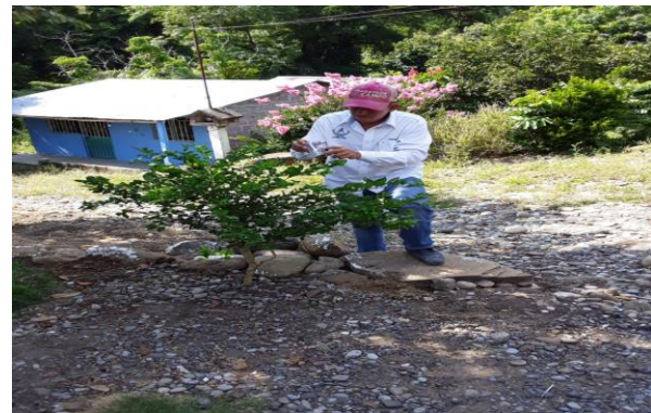
Figura 6. Toma de muestras de psílidos en rutas urbanas

d) Control químico. Con respecto al control químico este se llevó a cabo en 960.00 ha correspondientes a la AMEFI 01- Fco. Z. Esta actividad se realizó a fin de disminuir las poblaciones de diaforina y evitar daños a la brotación de este periodo.