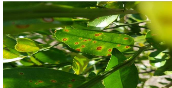
Figura 3. Exploración para detección de síntomas de Leprosis