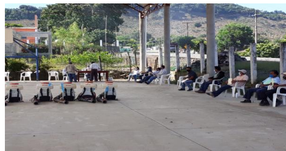
Figura 8. Talleres participativos a productores sobre síntomas de plagas reglamentadas de los cítricos

f) Entrenamiento: Con el propósito de difundir la estrategia operativa de la Campaña, así como la sensibilización hacia los productores sobre la importancia de las enfermedades y adopción de las acciones mediante el establecimiento de AMEFIs, se realizaron 4 Talleres Participativos en los Municipios de Fco. Z, Mena, correspondiente a la Región Sierra Norte; Acateno y Ayotoxco de Guerrero, correspondientes a la Región Sierra Nororiental. Con esta acción se benefició un total de 96 productores.