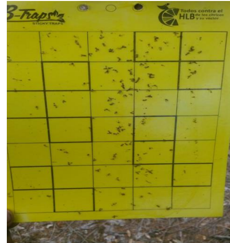
Figura 2. Trampas establecidas y revisadas para el monitoreo del PAC.

El promedio de diaforinas obtenido en el mes de marzo fue de 3.82 diaforinas/trampa/mes